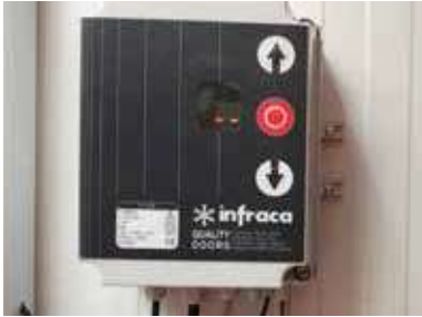
Cuadro de control IF10VF