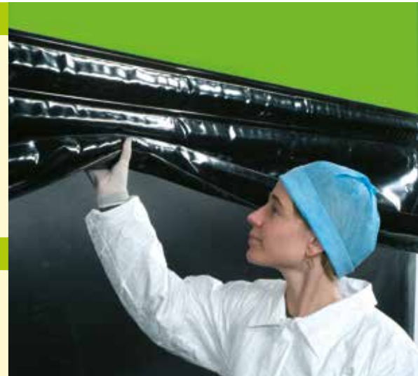
> Cortina inteligente de seguridad

El motor de accionamiento directo, de fiabilidad acreditada, proporciona unas prestaciones de larga duración. Esta tecnología permite el uso de cadenas y reduce el mantenimiento. Se reduce el desgaste en general, ya que la puerta funciona con solo 5 piezas móviles (motor, caja de engranajes, interruptor de fin de carrera, barra enrolladora, manguito giratorio).