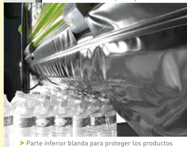
> Parte inferior blanda para proteger los productos