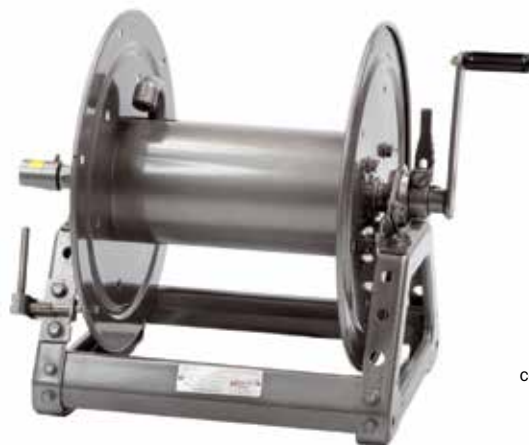
rebobinado con manivela